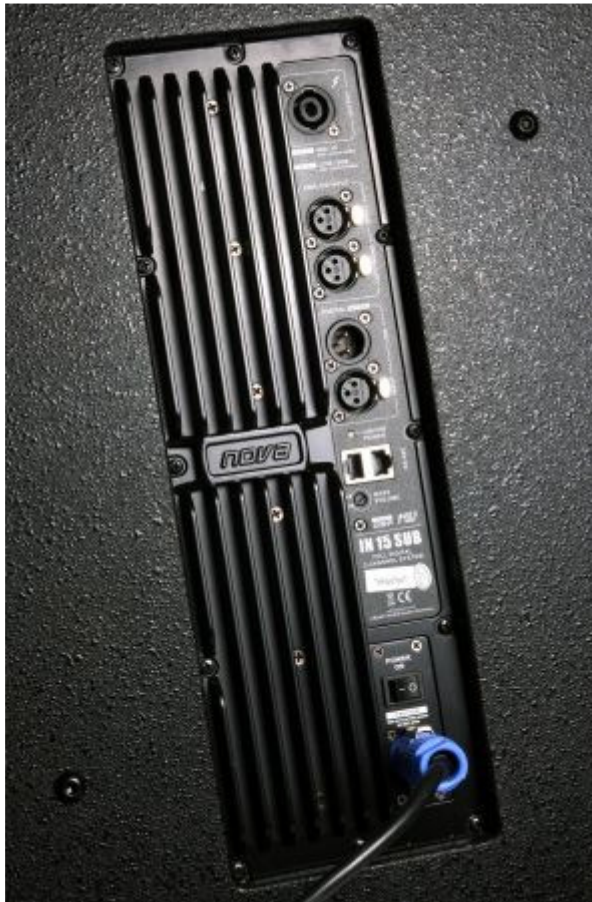
Anschlussfeld mit Kühlkörper im Subwoofer

Zur Schnittstelle schreibt Wikipedia: AES/EBU (Audio Engineering Society/European Union) ist eine umgangssprachliche Bezeichnung für die Spezifikation der Schnittstelle zur Übertragung digitaler Stereo-, Zweikanal- oder Mono-Audiosignale zwischen verschiedenen Geräten nach der Norm AES3. Sie wird hauptsächlich im professionellen Tonstudio-Umfeld verwendet.