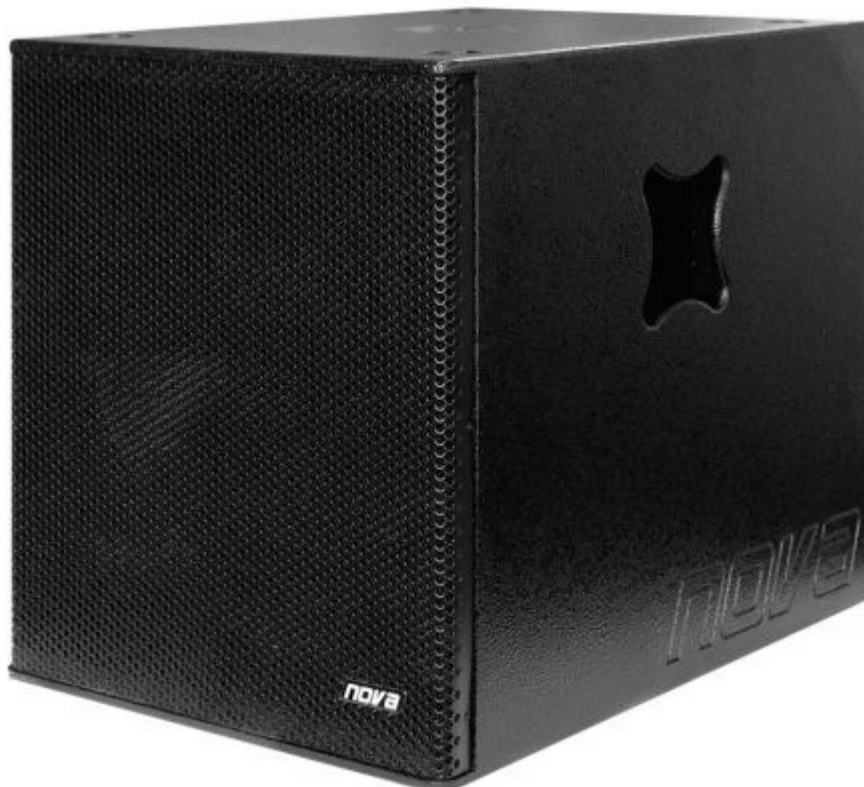
Die Endstufen im System-Subwoofer liefern 1.440 Watt

Der IN-15 Sub ist ein kraftvoller Aktiv-Subwoofer. Im Gehäuse (450 x 500 x 600 mm) aus 15 mm Birken-Multiplex, das wie die Topteile mit widerstandsfähigem Strukturlack versehen ist, sitzt neben dem langhubigen 15 Zoll Treiber auch die komplette Elektronik. Der Frequenzbereich der 8 Ohm Box reicht von 37 Hz bis 300 Hz. Zwei eingefräste Tragegriffe sind beim Transport des 37 kg schweren Würfels hilfreich. Auf der Oberseite fehlt der 20 mm Flansch nicht, der zur Aufnahme der Distanzstange für das Säulentop gedacht ist. In jedem Subwoofer arbeiten zwei lüfterlose, digitale Class-D Endstufen mit Schaltnetzteil. Damit ist laut Hersteller eine Systemleistung von 1.440 Watt möglich, 440 Watt für den Mittel-/Hochtonbereich und 1.000 Watt für die Bässe.