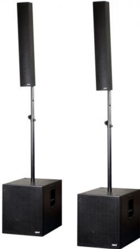
i.Nova 8 Power System

Die Idee ist alt, und jeder hat bestimmt schon einmal die länglichen Lautsprecherboxen irgendwo gesehen. Aus Kirchen, öffentlichen Gebäuden oder Veranstaltungshallen kennt man sie. Rund um meinen Wohnort sind etliche Dorfgemeinschaftshäuser damit ausgestattet. Die Rede ist von Säulenlautsprechern. Derzeit erleben diese Beschallungssysteme im PA-Bereich eine sagenhafte Renaissance. Mehrere kleine Treiber sind auf einer Linie angeordnet und ergeben so die typisch langgestreckte Form des Line Arrays mit seiner speziellen Abstrahlcharakteristik. Anders als konventionelle Lautsprecherboxen, die als Punktschallquelle bezeichnet werden, erzeugen Linienstrahler eine sogenannte Zylinderwelle. Diese hat die Eigenschaft, in der Tiefe des Raumes weniger Lautstärkeverluste aufzuweisen und bietet obendrein einen breiterem Abstrahlwinkel. Der Vorteil: Das gesamte System kann leiser gefahren werden. Vorn bei den Boxen ist es nicht brüllend laut, und auch hinten wird besser gehört. Zudem sehen die Mittelhochton-Säulen meist schlank und zierlich aus. Diese dezente Gestaltung lässt je nach Art der Veranstaltung einen weniger „bedrohlichen“ Eindruck entstehen als fette PA-Anlagen links und rechts der Bühne.